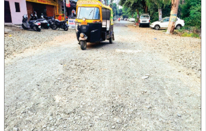
सीहोर। रेलवे स्टेशन रोड जो लंबे समय से जर्जर अवस्था में है।