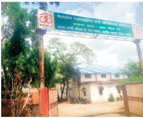
हरिभूमि न्यूज ब्यावरा

1 महीने बाद भी नहीं हो पाया कलेक्टर के जांच आदेश पर अमल