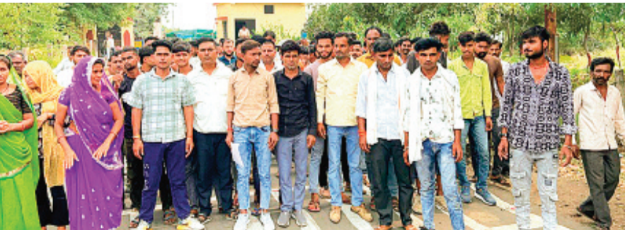
हरिभूमि न्यूज राजगढ़

घटना में एक गर्भवति महिला सहित 8 लोग हुए थे घायल, 4 गंभीर