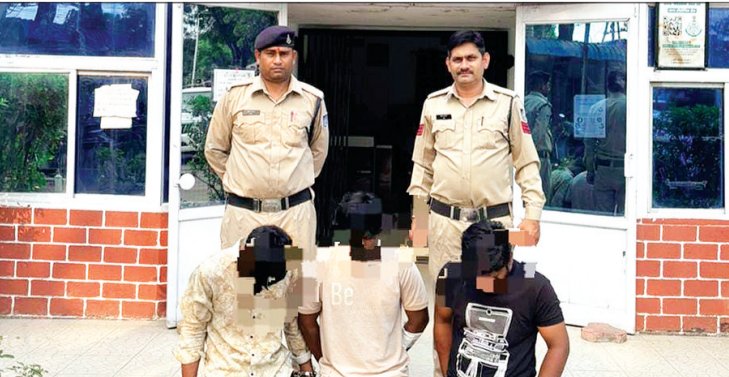
थाना औद्योगिक क्षेत्र की पुलिस टीम मौके पर पहुंची और स्थिति पर नियंत्रण पाया पुलिस ने