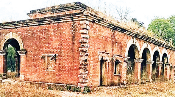
हरिभूमि न्यूज़ ललितपुर