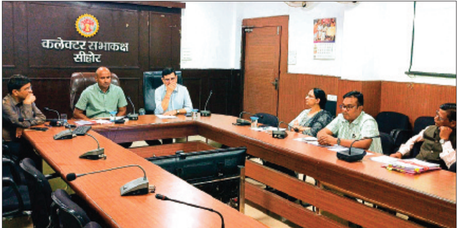
जाए, ताकि योजनाओं का लाभ पात्र किसानों तक सटीक रूप से पहुंच सके। उन्होंने कहा कि भावान्तर योजना का सभी पात्र किसानों को लाभ मिले इसके लिये राजस्व एवं कृषि अधिकारी समन्वय के साथ

बैठक में कलेक्टर ने फसल कटाई प्रयोग, सोयाबीन फसल के उत्पादन पर सतत निगरानी रखने तथा भावांतर भुगतान योजना के अंतर्गत सोयाबीन फसल का 'स्मार्ट सत्यापन' सुनिश्चित करने के निर्देश भी दिए। उन्होंने कहा कि जिन किसानों को फसल क्षति का लाभ दिया गया है, उनकी जानकारी को भावांतर योजना से समन्वित किया