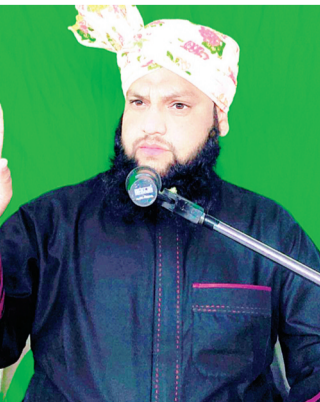
बताया कि आपके साथ कई करमात