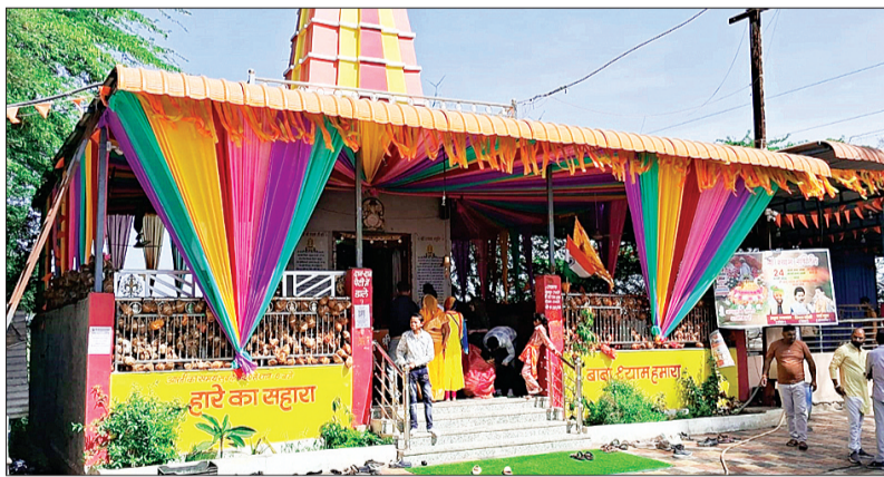
होगा। पूर्णाहुति, महाआरती एवं भंडारा 2 नवंबर को होगा। श्री बाबा खाटू श्याम सेवा समिति ने इस बार फिर मेले का आयोजन भी रखा है। मेले में जो