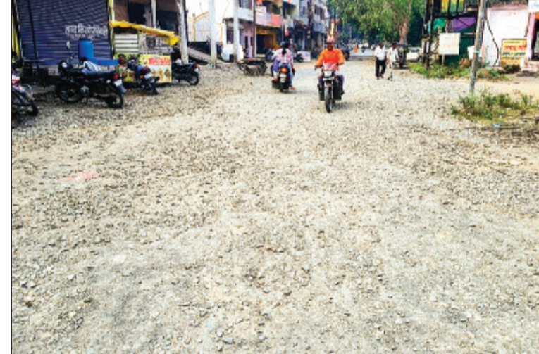
सीहोर। जर्जर सड़क पर धूल के गुबार लोगों के लिए परेशानी होती है।

अब जबकि पार्षदों के पास विकास के लिए महज एक साल बचा है, चौथे साल में चुनावी सरगमियां शुरू हो जाएंगी। पार्षद बनने की चाह रखने वाले नए नेता भी सक्रिय हो जाएंगे, जिससे वार्डों में घमासान मचना तय है। वार्डवासियों का कहना है कि जब भी वे पार्षदों से काम के लिए कहते हैं तो उन्हें यही सुनने को मिलता है कि वार्ड में सड़क-नाली निर्माण, विकास काम कराऊंगा, तभी वोट मांगने आऊंगा। लेकिन इस कोरे आश्वासन की वजह से पार्षदों की नेतृत्व क्षमता पर भी सवाल उठने लगे हैं। दिग्गज नेताओं की मौजूदगी भी बेअसर : इस परिषद की एक ओर खास बात यह है कि इस परिषद में दिग्गज नेता शामिल